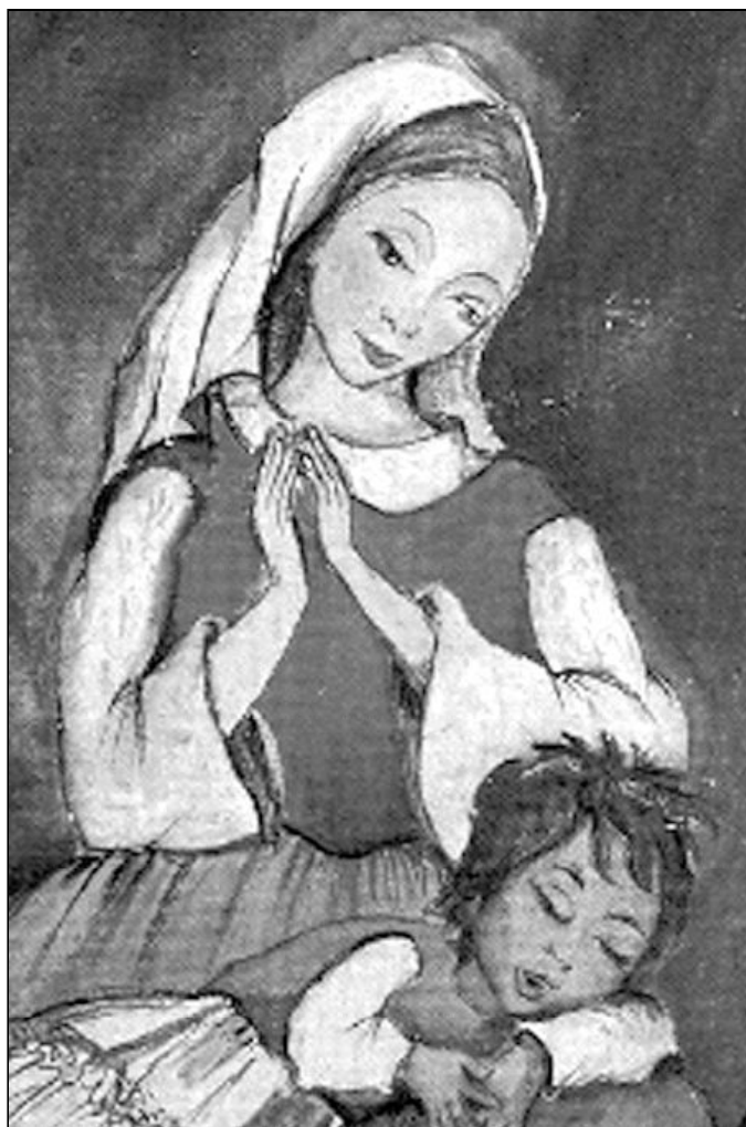
Imagen de la "Majari", como conocen los gitanos a la Virgen María

Las acciones y actividades no están exentas de dificultades y desalientos. Uno de los pilares es la paciencia y la gratuidad. No se